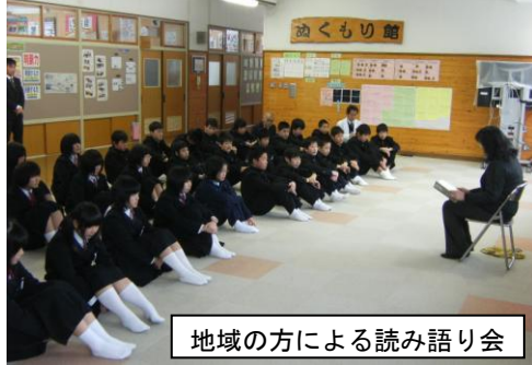
地域の方による読み語り会

先日、可茂地区学校図書館「奨励賞」を頂きました。今年度は読書活動の充実を図る様々な取り組みを進めてきました。右の評価コメントにも記されていますが、図書館をより身近に感じさせ興味関心を引き出すことで、読書冊数や貸出冊数も学期毎に増えてきています。また、朝読書の時間を利用して地域の方による読み語りも行われ、今まで以上に良い読書習慣が身に付きつつあります。