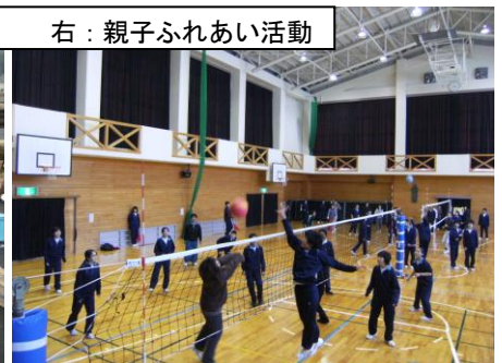
右：親子ふれあい活動