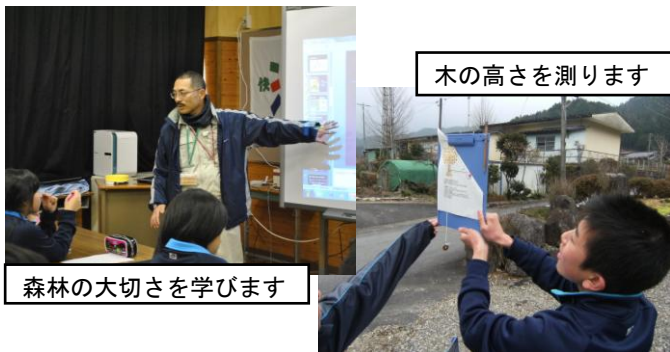
木の高さを測ります

可茂農林事務所の協力で1年生の森林学習が行われました。森林の機能や実態、樹木を育てることの重要性をなどについて学び、身近な道具を使って木の高さを測る実習も行いました。来週は吉田の学校林で間伐体験を行う予定です。