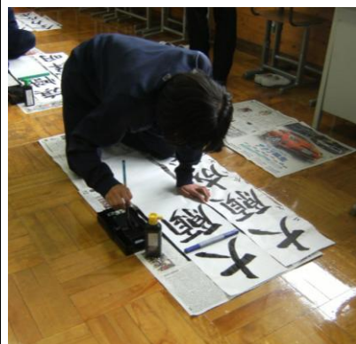
決意の書き初め文字一覧表

新しい年を迎え、今年の決意を文字に表わす「新年書き初め会」が行われました。心を落ち着かせ、一文字一文字に願いを込めて丁寧に筆をすすめていました。