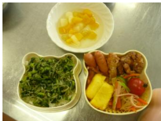
おいしいお弁当 完成

「好きな給食メニューからお弁当を作ろう」というテーマで3年生がお弁当づくりに挑戦しました。キーワードは「手早く、おいしく、美しく、安全に」。各グループとも彩りのよいおいしい弁当が出来上がりました。