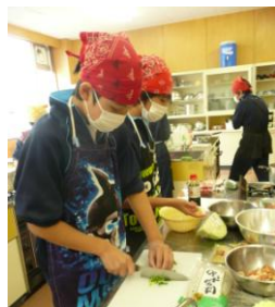
手際良く調理しました