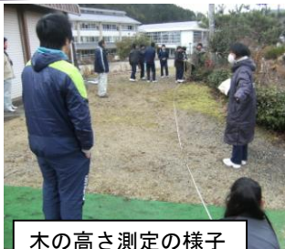
木の高さ測定の様子

総合の時間に可茂農林事務所の職員の方に森林の働きや現状、機能について話を聞いた後、木の高さ測定に挑戦しました。1月には佐見地区内の間伐体験を行う予定です。