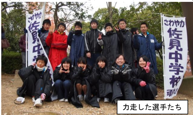
力走した選手たち

12月2日(日)八百津～美濃加茂間を走る加茂駅伝が行われ、男女とも昨年を大きく上回るタイムで最後までタスキをつなぎ力走しました。順位は奮いませんでしたが、女子は昨年6位相当タイムでした。皆さん温かいご支援ありがとうございました。