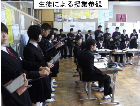
全体交流会の様子