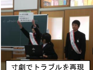
寸劇でトラブルを再現

今年度2回目の人権集会が行われました。今回は「素直に話し合おう～ネットの人権について」と題し、メールでのやり取りで起こるトラブルを具体的な例を取り上げながら、その対応の仕方について意見を交流しました。「大切なことは、メールではなく直接話して伝えることが大事」など、ネットの上手な使い方についてのよい話し合いができました。