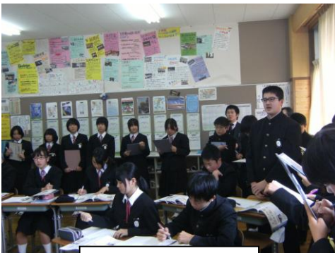
生徒による授業参観

生徒自らが授業の質の向上に取り組み、お互いのよさを学び合おうと生徒会学習委員会による「授業交流会」が行われました。本校では初めての取り組みでしたが、各学年の目指す姿について授業参観を通して理解し、全体交流会では他学年のよさを出し合ったり、自分の学年の課題について語ったりなど活発な議論が交わされました。「授業に対して全校で議論したことは大きな成果だと思う。活気のある授業を目指したい。」「根拠を明確にして大きな声で発言することが大切だと思った。」「全員が自由に発言できる授業を目指したい。」など目指す授業像についても意見を交流しました。今後も『教科のことば』を使って話せる生徒を目指し、主体的な取り組みを進めていってほしいと思います。