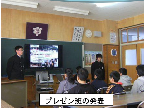
プレゼン班の発表

新1年入学説明会を実施しました。中学校生活の概要について、現在の1年生が冊子班ムービー班