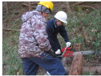
チェーンソーにも挑戦!