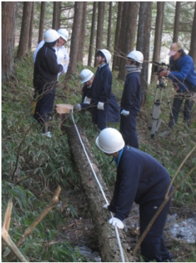
何メートルあるかな?