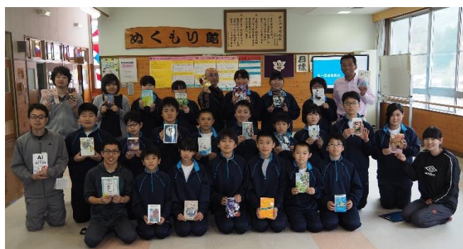
一人一人のオススメ本を手に記念撮影